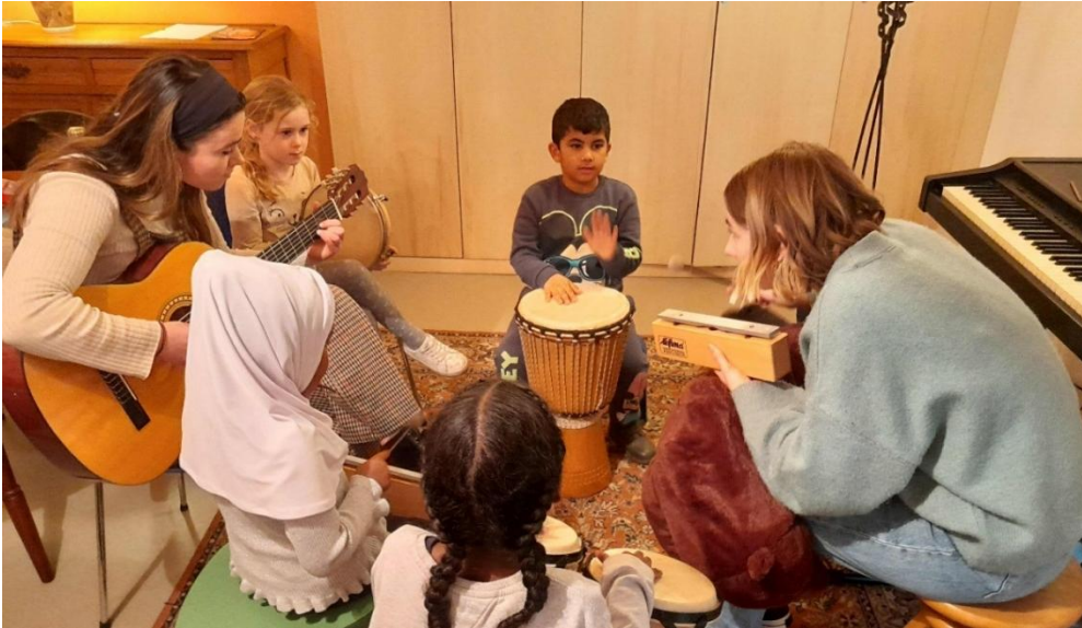
Een les "Muziek en Spel" voor 5-7 jarigen door stagiaires van de HAN.