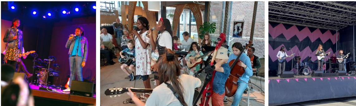
Optredens in Muziekgebouw, de Eindshow bij KEVN en het Woensel Westival.

Op het Woensel Westival eind september stonden twee bandjes van "In the Mix" op het podium. Met alleen maar zelf geschreven nummers en teksten!