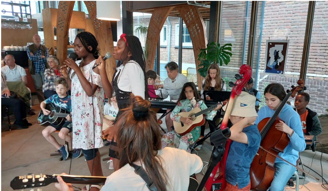
Eindshow bij KEVN – juni 2024