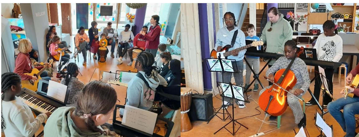
Muziekworkshop voor jong en oud bij T+-huis in Hemelrijken in de meivakantie.

Sinds 23/24 werken we hiervoor ook samen met bewonersorganisatie Trompstraat, de volwassenen NL-les van Stichting Les in de Buurt en met het T+huis. Deze drie partners hebben een fijne samenwerking, waardoor volwassenen en kinderen van alle culturen makkelijk bereikt kunnen worden met dit aanbod. In mei organiseerden we samen een workshop bij het T+huis. Met een mix van alle culturen en jong en oud werden instrumenten uitgetoetst en werd hard geoefend. Aan het einde van de middag speelde/zong de groep samen een eigen versie van "Kleine Café aan de Haven".