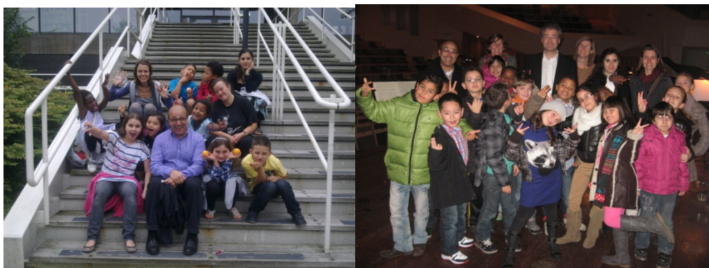
Excursie juni familieconcert Symfonie Orkest Eindhoven en december Het Brabants Orkest.

Kinderen doen altijd eerst mee aan een korte workshop van 8 a 10 lessen. Als ze in die periode laten zien dat ze echt interesse en/of talent hebben, krijgen ze de gelegenheid om in vervol-groepen deel te nemen. De instrumenten en materialen worden ofwel gehuurd ofwel aangeschaft door Stichting Hengel.