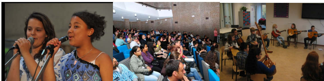
Optreden en workshops: Woensel West Works, publiek bij het Slotconcert, Workshop HBO