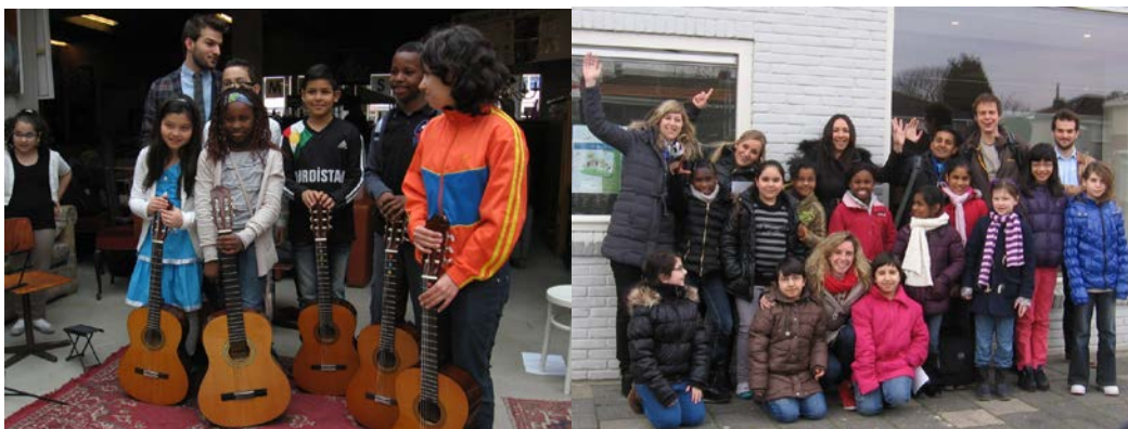
Gitaaroptreden bij Emmaus en met de Rabobank naar het Parktheater voor een toneel Workshop

In 2013 is gestart met een beginners klasje met algemene muziektheorie en kennismaking met de verschillende instrumenten. Als ze in die periode laten zien dat ze echt interesse en/of talent hebben, krijgen ze de gelegenheid om voor een instrument te kiezen. De instrumenten en materialen worden ofwel gehuurd ofwel aangeschaft door Stichting Hengel.