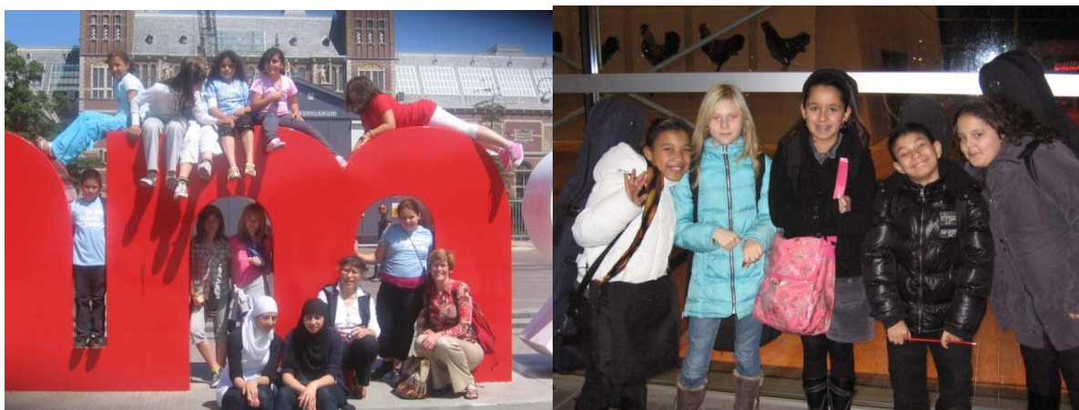
xkursies mei Concertgebouw en november Mega Kinder Cello Orkest Amsterdam

Kinderen doen altijd eerst mee aan een kortere workshop van 8 a 10 lessen. Als ze in die periode laten zien dat ze echt interesse en/of talent hebben, krijgen ze de gelegenheid om in vervolg-groepen deel te nemen. De instrumenten en materialen worden ofwel gehuurd ofwel aangeschaft door Stichting Hengel.